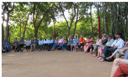
El Círculo de Representantes con invitados