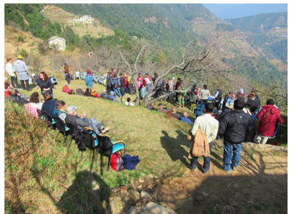
En el proyecto Binita Shah en el Himalaya