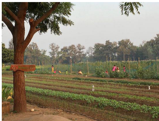
La granja biodinámica de Sarvdaman Patel