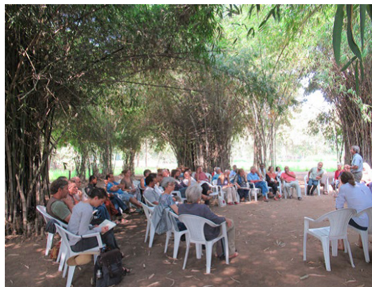
La "Catedral de Bambú" Foto: Uli Johannes König