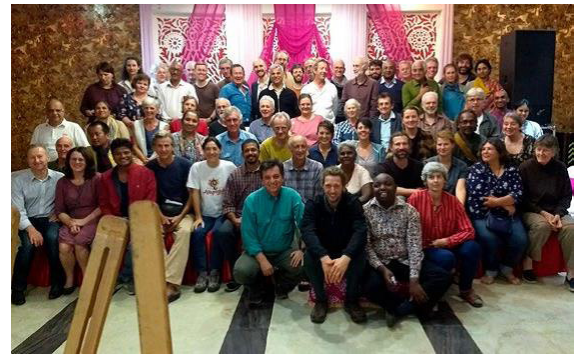
Encuentro de agricultura biodinámica internacional cerca de Delhi.

El viaje ha reunido al movimiento de la agricultura biodinámica mundial de forma por completo diferente a la que hubiera sido en Europa, posibilitando un contacto más directo con el gran movimiento de la agricultura ecológica. Los participantes del Congreso Mundial Orgánico constataron la destacada presencia de agricultores e investigadores biodinámicos. Gracias a esto, el movimiento biodinámico logrará en el futuro una mayor presencia de su importante contribución al movimiento ecológico. Estar junto a ellos ha fortalecido tanto nuestro propio impulso, como ha favorecido una mayor apertura hacia nuestro movimiento.